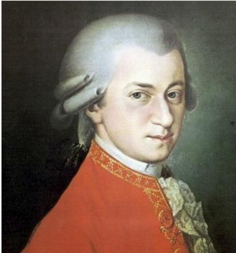
W.A. Mozart skrev sin första symfoni som 8-åring.