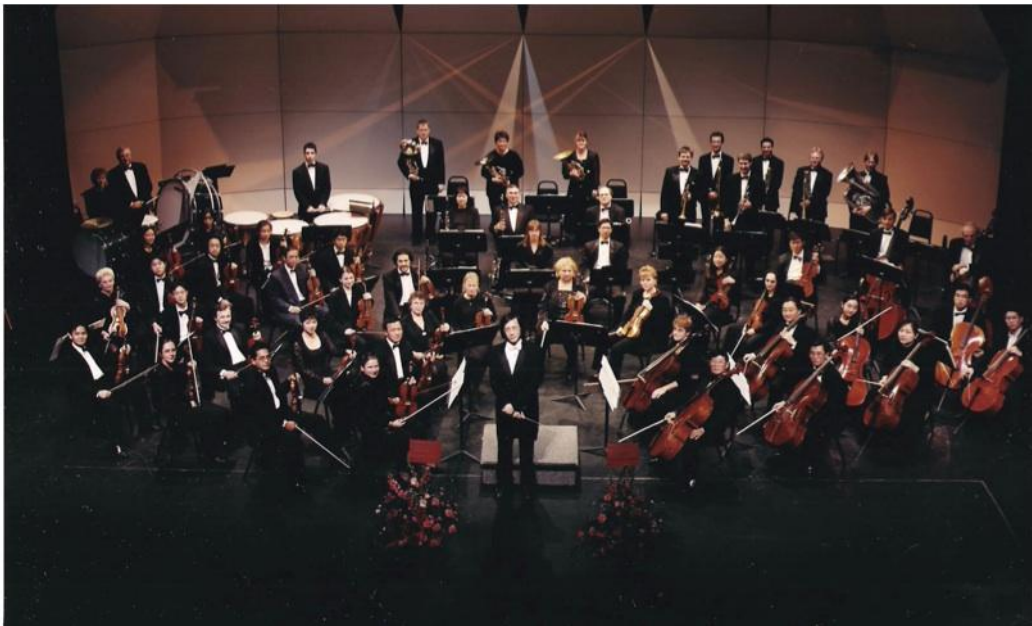
Symfoniorkestern fick sin nuvarande form under 1800-talet.

Beethoven var den förste tonsättaren som uppnådde "idolstatus" och han ses ofta som den första av romantikerna, med ena benet i klassicismen och det andra i romantiken. Under 1800-talet fanns det ofta en personkult runt kompositörer och kända musiker. Vissa sågs som något mer än skickliga hantverkare och tillskrevs ibland övermänskliga egenskaper. Ett exempel på detta är superviolinisten Paganini , som påstods ha skrivit kontrakt med djävulen. Han sålde sin själ till "den lede" för att i utbyte bli den mest fulländade violinist världen dittills skådat. Liknande skrönor spreds på annat håll. Under 1940-talet, i Amerika, sades den mytomspunne bluesgitaristen Robert Johnson ha erövrat sin bländandespelteknik på samma sätt. Det här har överlevt till våra dagar och idolstatus och dyrkande fans är nu en självklar del av att vara pop- och rockstjärna.