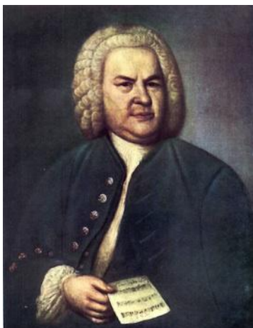
J.S. Bach, tidernas kanske störste improvisatör.

Den kan beskrivas med orden liv , rörelse och kraft , vilka var ledorden under denna tid. Särskilt Bachs musik är typisk för epoken. Så stilbildande för barocken är Bach att epoken går i graven med honom. Han fulländade denna musik. Lyssna på hans orgelmusik, och du får essensen av barockmusiken.