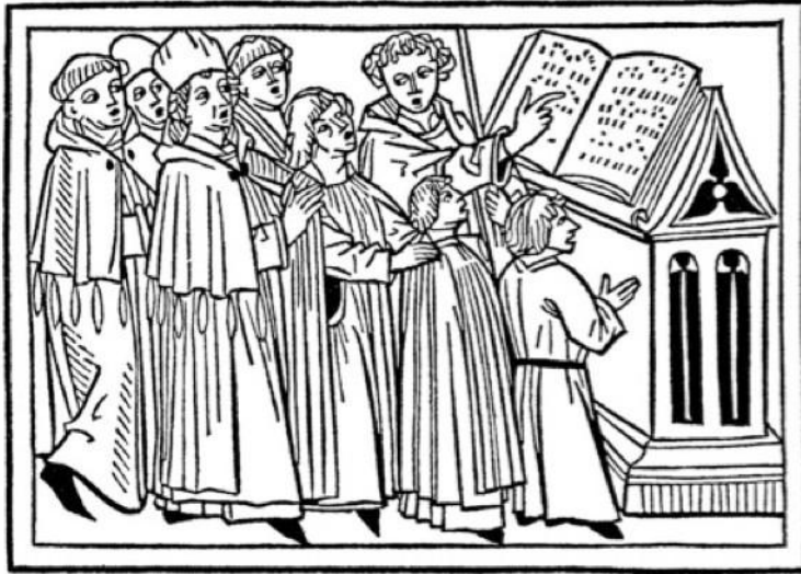
Sjungande munkar; gospelmusikens föregångare.

texten, Bibelns ord, som var det viktiga, inte musiken. Därför fick inte musiken vara för bra, eller intressant. Musikens uppgift var bara att förstärka bibelordens, Guds, budskap.