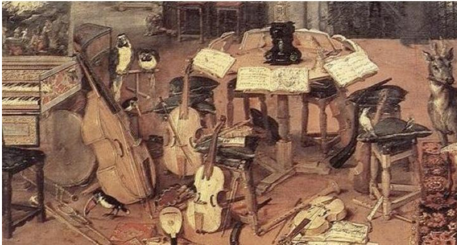
Musikinstrument från renässansen.