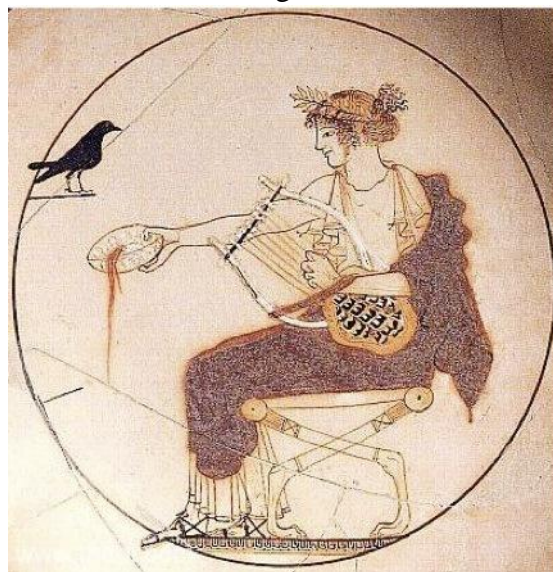
Den grekiske guden Apollon med lyra.