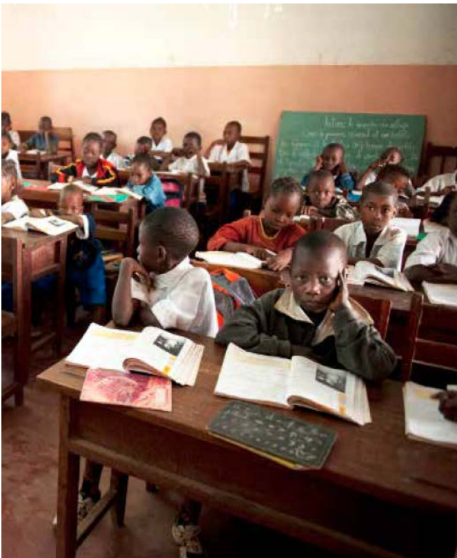
Skolan i Bouar tar emot elever från barnbyn och andra familjer i närområdet.

behöver. Skolan och medicinkliniken erbjuder utbildning och hälsovård till tusentals familjer i barnbyns närområde. Barnbyn består av tolv familjehus, med plats för 7 - 10 barn i varje hus. Förskolan, skolan och medicinkliniken erbjuder erbjuda tiotusentals barn och familjer hjälp och stöd. I de fallfärdiga skolor som finns i området sedan tidigare har barnen trängts i överfyllda klassrum, samtidigt som bristfällig vård erbjuds i smutsiga behandlingsrum, så skolan och